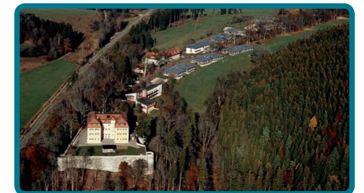
So sieht Grafeneck heute aus der Luft aus